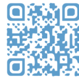
Site web du colloque